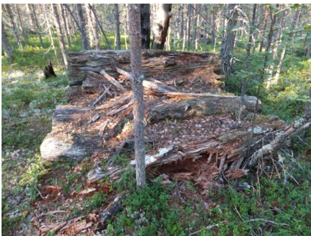
Остатки штабеля бревен близ Круглого озера.

О том, как велись лесозаготовки, их свидетель писал так: «На работу заключённые идут до 10 километров. И чем дольше они работают, тем дальше и дальше им приходится ходить: