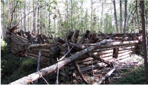
Малый барак на Гоголином озере, Ковдский полуостров.