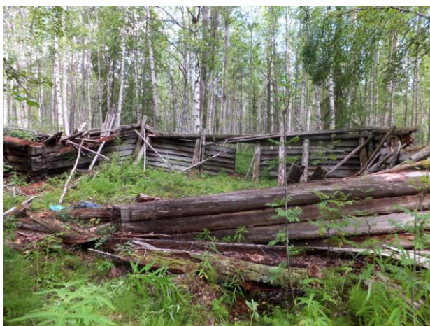
Большой барак на Верхнем Ершовском озере, полуостров Киндо. Правое жилое крыло и центральная часть с маленькой комнатой.