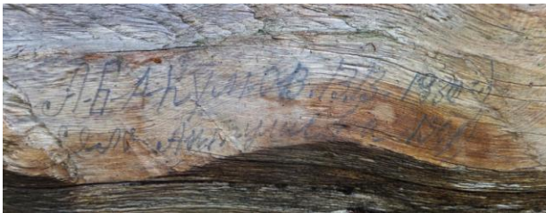
Надпись на стене барака. Гоголиное озеро.