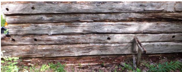
Отверстия в стене и сохранившаяся часть встроенной конструкции. Круглое озеро.